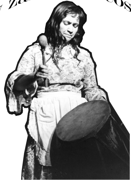
Fanzine crítico de arengas