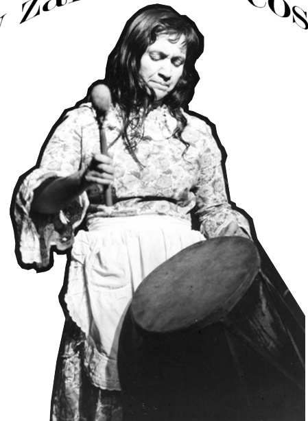
Fanzine crítico de arengas